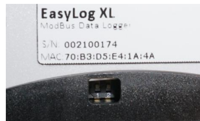
Fig. 6 Esempio posizione DIP-SWITCH OFF OFF

N.B. Usare questa opzione collegando al massimo un solo EasyLogXL nella stessa rete LAN.