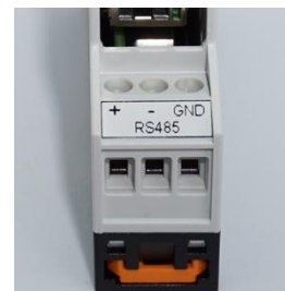
Fig. 2 Connettore RS485 ←

Se si utilizza la seriale per la lettura dei dati da dispositivi ModBus RTU collegare i fili della RS485 come da figura seguente: