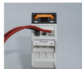
Fig. 4 Connessioni alimentazione ←

N.B: Si raccomanda di rispettare la polarità